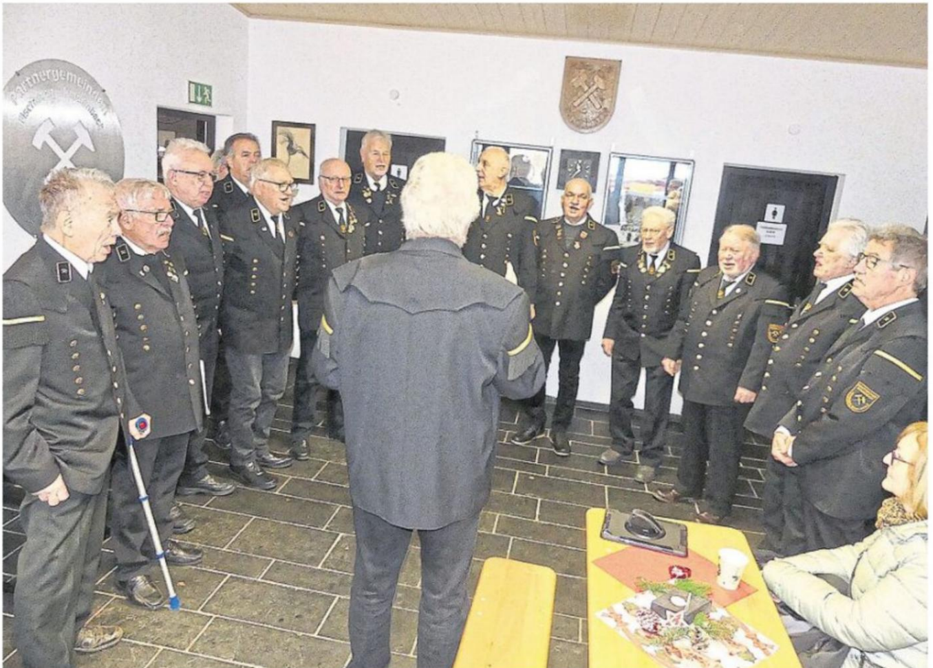
Die Barbarafeier wurde musikalisch umrahmt vom Knappenchor Bundenbach und dem MGV Kirn-Sulzbach.

Barbarafeier in Bundenbach war gut besucht – Gedenken an den verstorbenen Dirigenten