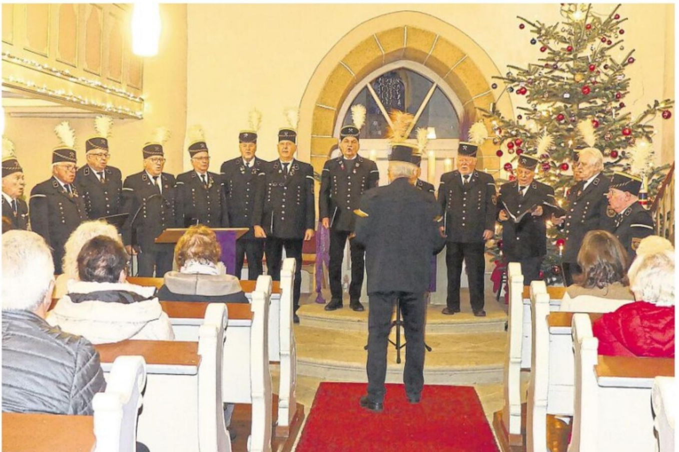
Der Knappenchor aus Bundenbach hatte zum Weihnachtskonzert in die Wickenrodter Kirche eingeladen.